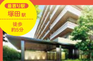
最寄り駅 塚田駅 徒歩 約5分

パークホームズ 船橋塚田 船橋駅を生活圏にする、閑静で緑豊かな住宅地に全107戸の邸宅が誕生。