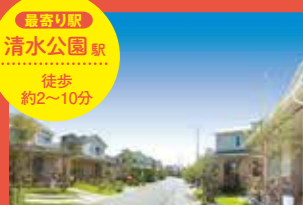
最寄り駅 清水公園駅 徒歩 約2~10分

ソライエ清水公園 アーバンパークタウン 約500区画の分譲開発プロジェクト!駅前の「ソライエひろば」を拠点とし、コミュニティ豊かな街づくりに取り組んでいます。