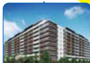
ソライエ 流山おおたかの森