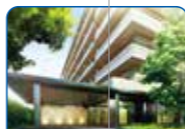
パークホームズ 船橋塚田