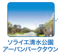
ソライエ清水公園 アーバンパークタウン