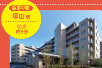
最寄り駅 塚田駅 徒歩 約6分

船橋「丘の手」住宅エリアの便利さと気持ちよさを満喫できる129戸の高台のレジデンス。