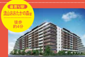
最寄り駅 流山おおたかの森駅 徒歩 約4分